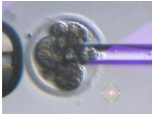
Abb.5: Blastomerenbiopsie am Mausembryo

Am (nächsten Tag) Samstag konnten die erlernten Techniken, besonders begeistert natürlich die ICSI, von uns nochmals ausprobiert werden. Danach wurden innovative mikroskopische Verfahren wie die Spindel- und Zonaanalyse (OCTAX polarAIDE) und IMSI – „intracytoplasmic morphologically selected sperm injection“ (OCTAX cytoScreen) vorgestellt.