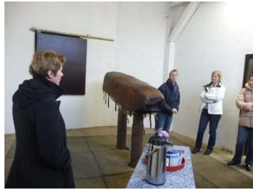
Abb.2: Hengststation Eicke in Einbeck